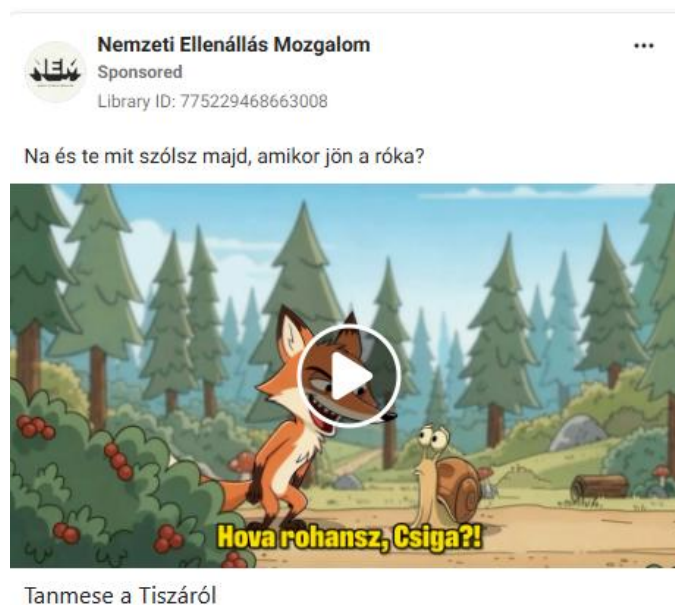
Tanmese a Tiszáról

Ez a rajzfilmstílusú hirdetéssel közvetített implicit politikai tartalom sikeres eszköznek bizonyult a Meta szűrőrendszerének megtévesztésére. A példa jól szemlélteti a politikai hirdetések szabályozásának és az előírások betartatásának nehézségeit, és mintaként szolgálhat más uniós szereplők számára is a hirdetési tilalom megkerülésére.