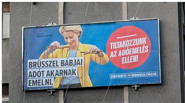
Összehasonlításképp: Egy lakóépületen elhelyezett, 2025. októberi, a Nemzeti Konzultációt népszerűsítő plakát.