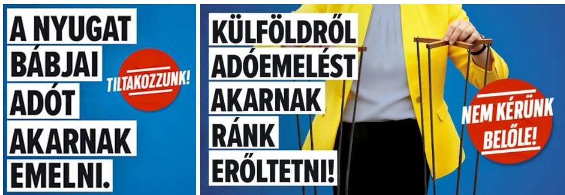
Mindkét hirdetés 2025. októberi. Baloldali kép: A Miniszterelnöki Kabinetiroda hirdetése, amelyet a Google politikai tartalma ellenére jóváhagyott, és nem-politikai besorolásúként kategorizált. Jobboldali kép: A magyar kormány hirdetése, amelyet a Meta hasonlóan politikai tartalma ellenére jóváhagyott, és nem-politikai besorolásúként kategorizált.

Ahogy az alábbi példák is jól szemléltetik, ezek a hirdetések a magyar kormány politikai ellenfeleit a Nyugat és Brüsszel bábjaiként ábrázolják, azzal vádolva őket, hogy hatalomra kerülésük esetén adót fognak emelni. Úgy tűnik ezeknek a hirdetéseknek a Meta felületekre készített verzióját kifejezetten a platform szűrőrendszerének a kijátszására irányuló szándékkal tervezték meg, az utcai plakátokon szereplő Ursula von der Leyen arca ugyanis ezekről a hirdetésekről hiányzik.